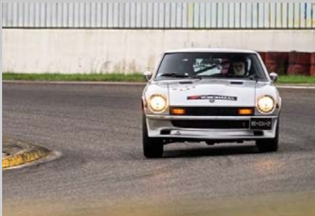
Simon et sa 280Z lors des 100 Tours de Nogaro