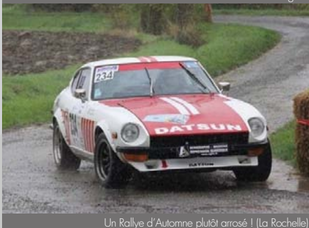
Un Rallye d'Automne plutôt arrosé ! (La Rochelle)